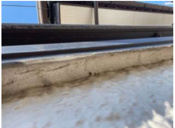
手摺の外側は塞がれている