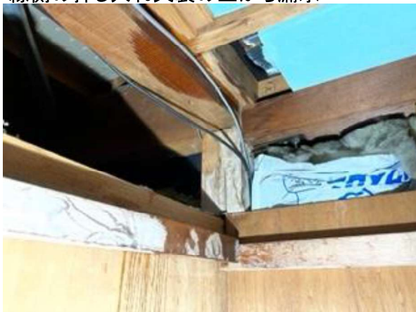
縁側の押し入れ天袋の上から漏水